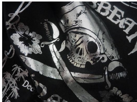
Lámina de metal brillante: Visualmente brillante se puede aplicar sobre cualquier color de prenda con un doble estampado. Producto ideal para resaltar un motivo a través del efecto metal y disponible en varios colores.